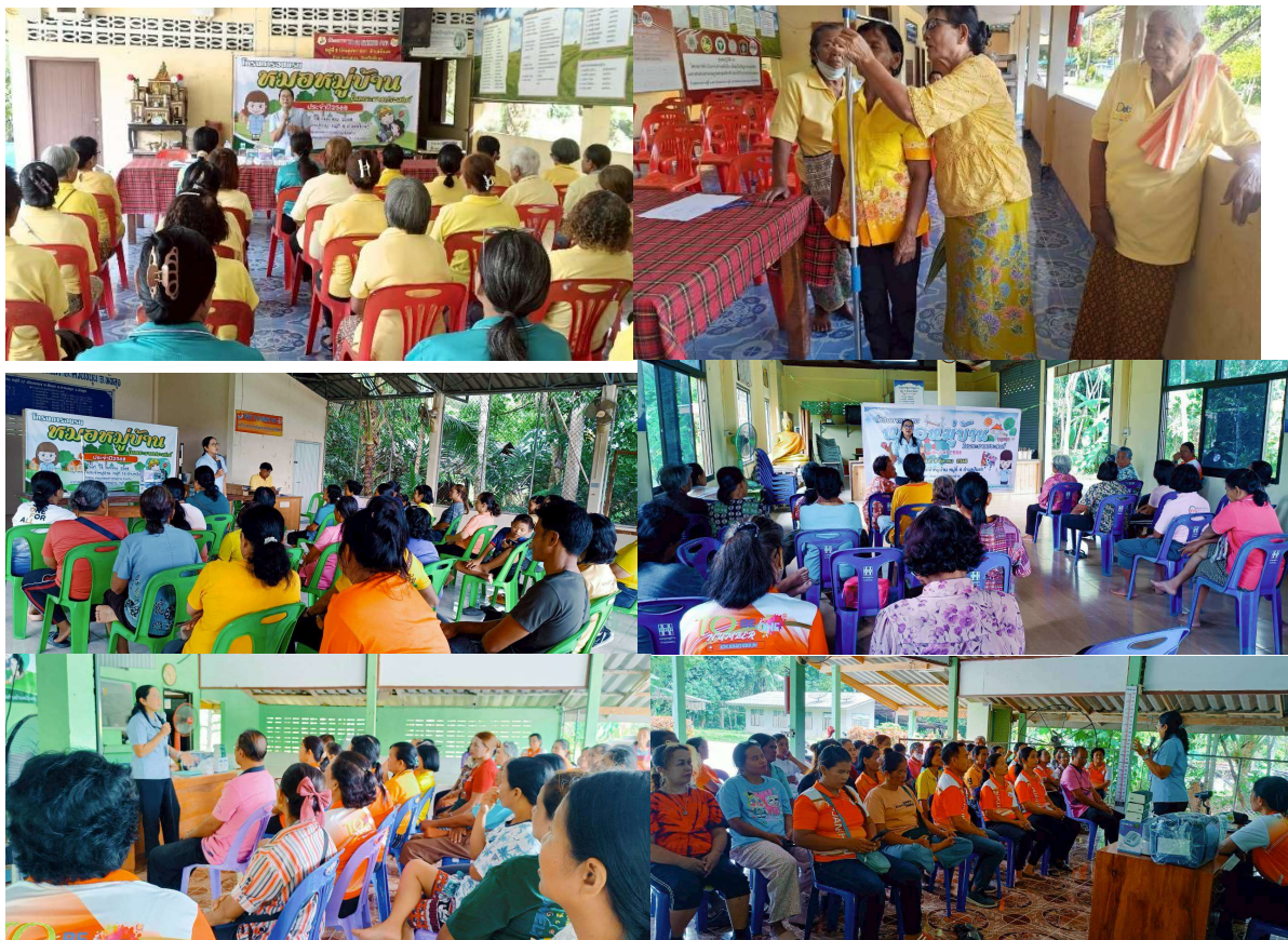
โครงการตรวจสุขภาพเคลื่อนที่ ประจำปี ๒๕๖๘ หมู่ที่ ๓ หมู่ที่ ๕ หมู่ที่ ๖ หมู่ที่ ๗ หมู่ที่ ๑๐ และหมู่ที่ ๑๓